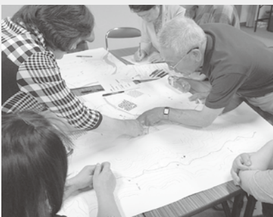
▶福祉委員研修会(和良地域)◀

地区社協活動、福祉委員活動、サロン活動、ボランティア活動、福祉情報の提供、高齢者等の生活支援、福祉共育(教育)活動や福祉車両貸与事業などの地域福祉活動に活用しています。