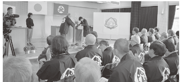
【福祉フェスティバル】