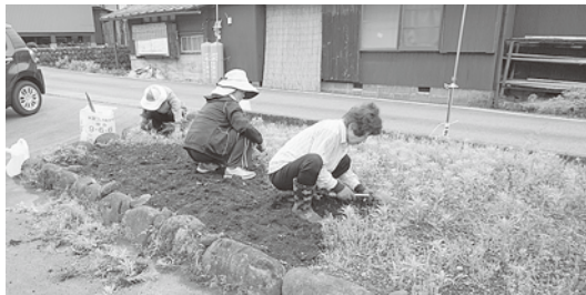
【ちよこっとささえ愛隊活動】

令和元年度も、世帯を対象とした「一般会費(1口1,000円)」と、法人や団体の方を対象とした「賛助会費(1口5,000円)」の募集をいたします。皆さま方のご理解ご協力をお願いいたします。